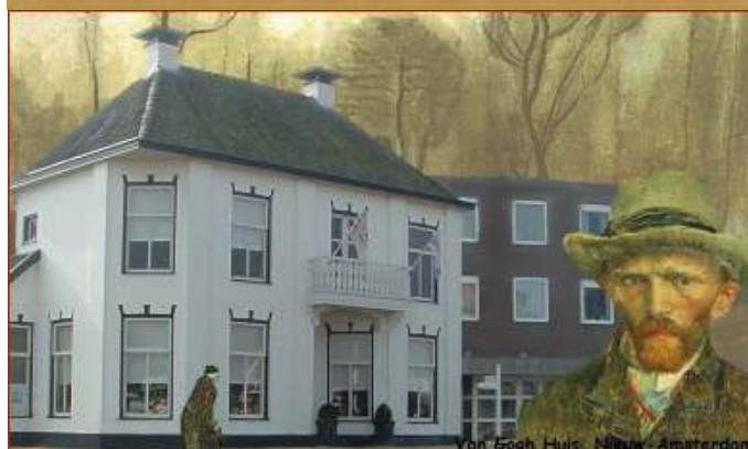
Van Gogh Huis, Nieuw-Amsterdam