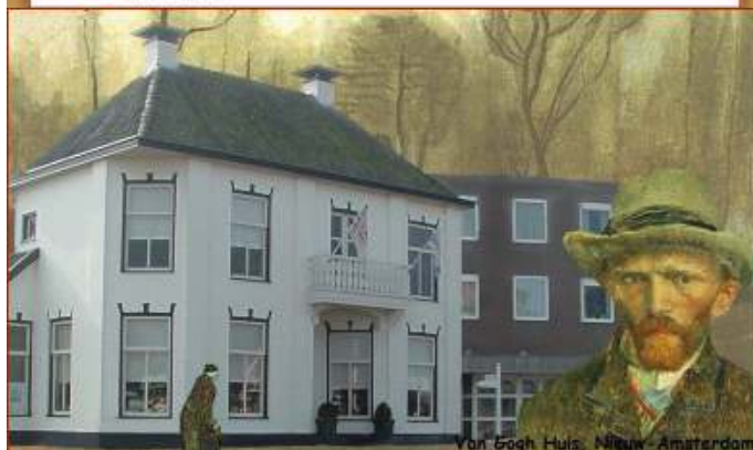
Van Gogh Huis, Nieuw-Amsterdam