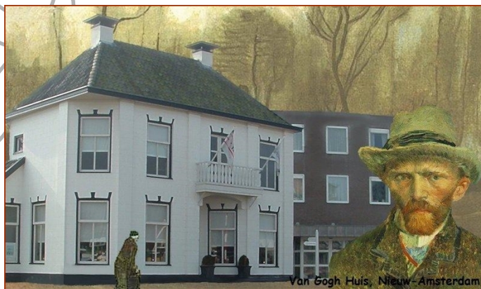
Van Gogh Huis, Nieuw-Amsterdam